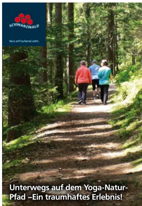
Unterwegs auf dem Yoga-Natur-Pfad – Ein traumhaftes Erlebnis!